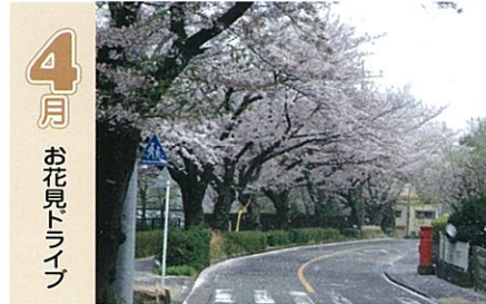
4月 お花見ドライブ