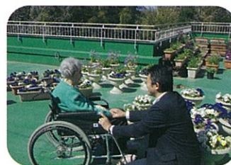
ベランダで外気浴