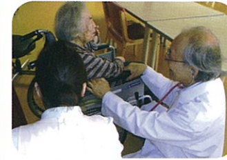
嘱託医による健康管理

看護師、機能訓練指導員が連携し、皆様の健康管理、身体機能の維持・向上を目指しております。