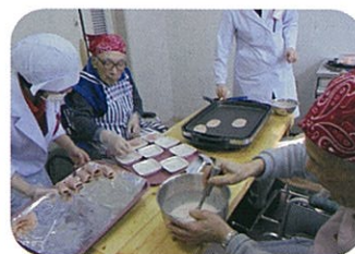
会支味(あじみ)クラブ