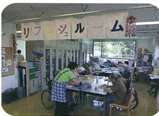
リフレッシュルーム

アクティビティ室では、趣味活動、クラブ活動などを行っております。また、5Fに喫茶室をご用意させていただいております。