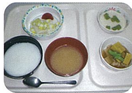
通常食のソフト食